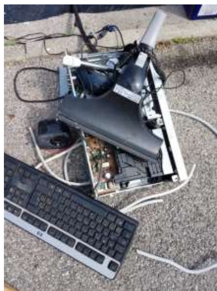
Slika 6: Odpadna električna in elektronska oprema