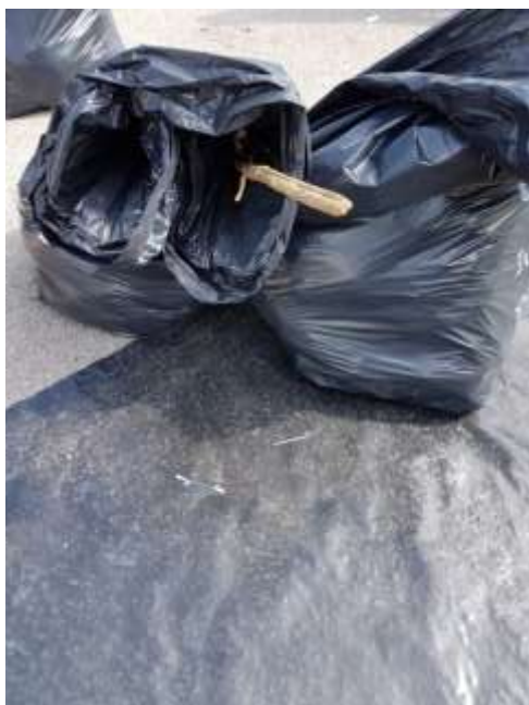
Slika 3: Biološko razgradljivi odpadki