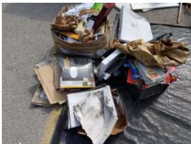
Slika 8: Papir in papirna embalaža