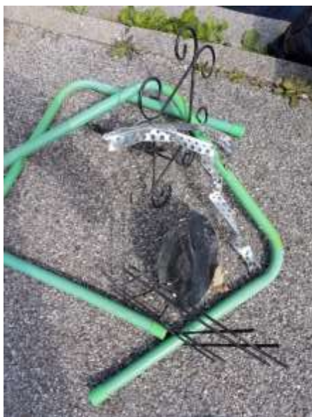
Slika 7: kovine- kosovni odpadki