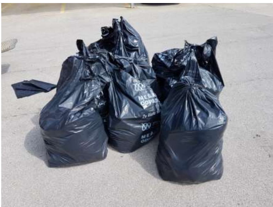
Slika 4: Mešani komunalni odpadki- del