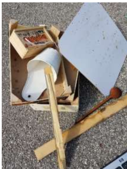
Slika 5: Leseni odpadki