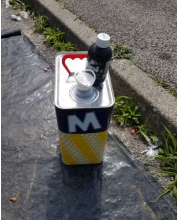
Slika 9: Barve in topila

Ugotovili smo, da velik del volumna (54%) odpadkov predstavlja mešana embalaža, ki se sicer zbira v ločenih zabojnikih. Med vsemi vrstami odpadkov so se nahajali tudi nekateri nevarni odpadki (npr. odpadna električna in elektronska oprema ter barve), ki nikakor ne sodijo med mešane komunalne odpadke. Tudi količina biološko razgradljivih odpadkov je nesprejemljiva, saj le ti znatno prispevajo k onesnaženosti drugih vrst odpadkov. Med biološko razgradljive odpadke smo izločili večje količine kruha, olupkov sadja in zelenjave, celo sadje in zelenjavo ter originalno predpakirano raznovrstno hrano.