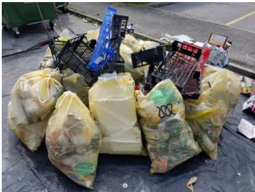
Slika 1: Mešana embalaža in ostala plastika