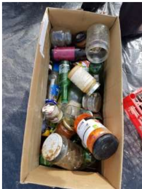
Slika 2: Steklena embalaža